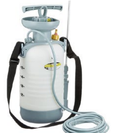
広範囲にはガーデンスプレー等 蓄圧式噴霧器を推奨します。