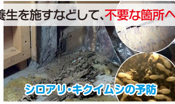
シロアリ・キクイムシの予防