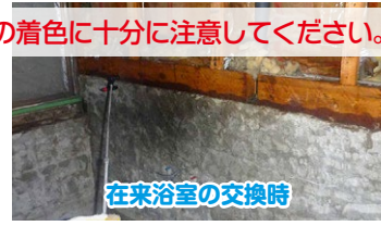
在来浴室の交換時