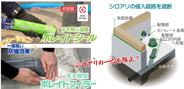
(公社)日本木材保存協会規格 JWPAS-TS-(1)(2011) 室内効力試験性能基準

2次防蟻・防霉 責任施工 お見積り・調査のご相談等お気軽にお問い合わせください。