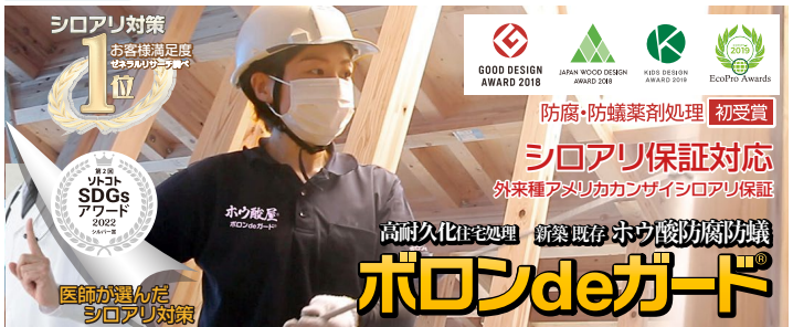
防霉防蟻性能: (公社)日本木材保存協会 JIS K 1571:2010 附属書A (規定)

2次防蟻・防霉 責任施工 お見積り・調査のご相談等お気軽にお問い合わせください。