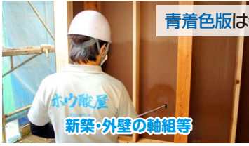
新築・外壁の軸組等

リノベーションでの壁や床、天井を開口した際の処理 フローリングや畳を敷く前の荒床の処理